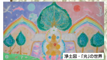
浄土図・「光」の世界