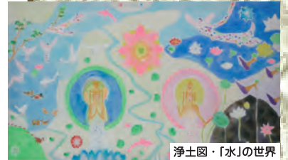
浄土図・「水」の世界