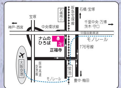
阪急蛍池駅より徒歩約10分

【主催】正福寺・ナムのひろば文化会館 〒563-0032 大阪府池田市石橋 4-15-14 (地図参照) 【連絡先】ナムのひろば文化会館(正福寺内) 《TEL》072-761-5552 《FAX》072-737-5440 《Mail》info@namosquare.org 《HP》http://namosquare.org