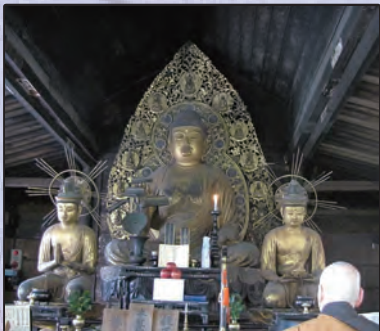
阿弥陀三尊 — 三千院・往生極楽院