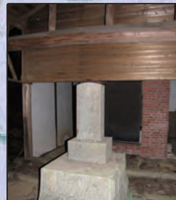
御霊屋 — 吉野郡笠木